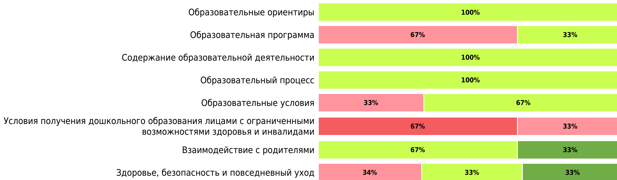
Доли ДОО с разными баллами у педагогов